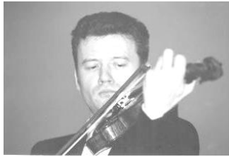
Ivan Zenaty, violín

Estudió en el Conservatorio de Praga. Ha recibido reconocimientos como ganador del Concurso Internacional de Violín Primavera de Praga (1987) o el Primer Premio de las clases magistrales internacionales Ruggiero Ricci en Berlín (1990), entre otros. Desde 1996 Iván Zenaty es profesor en la Academia de Música de Dresden. Iván Zenaty toca el famoso instrumento Prince of Orange hecho en 1743 por el maestro italiano Giuseppe Antonio Guarneri del Gesu.